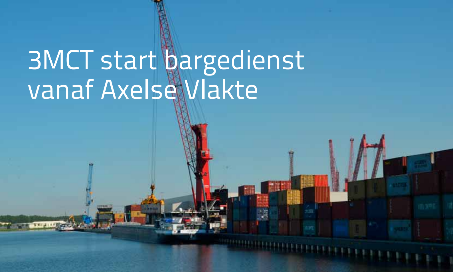
Kade van Vlaeynatie in Terneuzen.

De zeehavens van Rotterdam en Antwerpen ondervinden veel hinder van congestie op de aan- en afvoerverbindingen via weg en water. Tri-Modal Containerterminal Terneuzen (3MCT) speelt hierop in met een containerbargedienst vanaf de Axelse Vlakte. 3MCT is een joint venture van Swagemakers Intermodal Transport en Vlaeynatie. In samenwerking met diverse partijen, zoals Mammoet voor het laden en lossen van de containers, en de barge-operator, ging het bedrijf in het eerste kwartaal van 2016 van start met een lijndienst die twee keer per week in een vast vaarschema containerlading naar Antwerpen bracht. Al redelijk snel kon de dienst worden uitgebreid met een verdubbeling van zowel het aantal afvaarten als de capaciteit van de schepen. In de basis bestaat de lading uit eigen containers, maar uiteraard is de dienst ook bedoeld om lading van derden te vervoeren. Hiervoor wordt in de regio gezocht naar geschikte lading om zo steeds meer volume te kunnen bundelen en verder te kunnen opschalen. Om de diensten naar de klanten nog verder te kunnen optimaliseren wordt momenteel een terrein naast