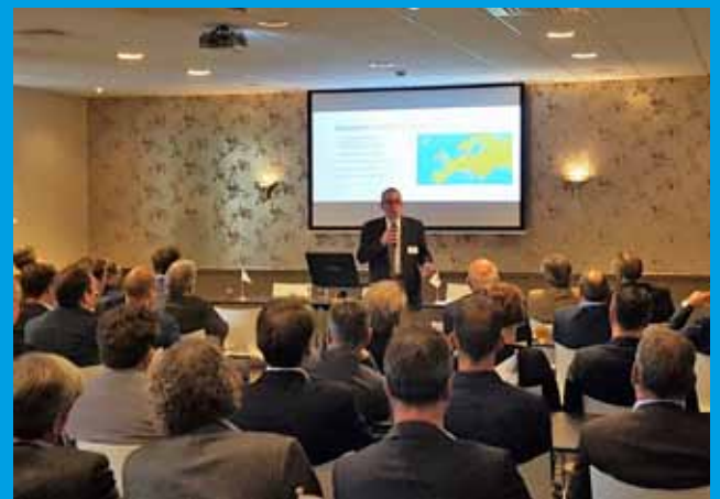
Met 72 aanwezige participanten was elke stoel bezet.

De volgende Algemene Participanten Bijeenkomst staat gepland op 22 november 2018.