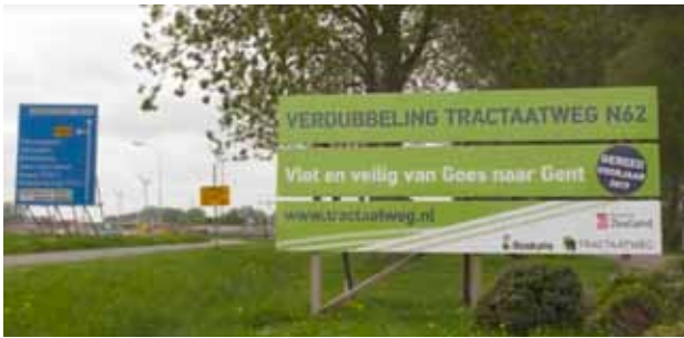
De werkzaamheden bij de Tractaatweg.

Wie de weg van Zelzate naar Terneuzen of omgekeerd neemt, is ongetwijfeld grote werkzaamheden tegengekomen. De Tractaatweg wordt namelijk verbreed. In het voorjaar van 2019 moet de Tractaatweg verdubbeld zijn van één naar twee rijstroken in beide richtingen. Deze verbindingsweg is een belangrijke schakel in de ontsluiting van North Sea Port. De verdubbeling van de Tractaatweg zal zorgen voor een vlotte en veilige doorstroming van het verkeer en het transport tussen de havengebieden van Gent, Terneuzen en Vlissingen.